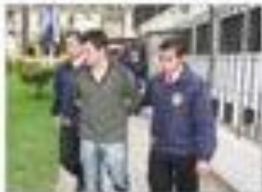
El grupo de hackers se dedicó a sustraer a clientes de millas aéreas de Valparaíso. El grupo, conocido como "Apocalypse", ha sido acreditado por la PDI por haber realizado 40 estafas virtuales a clientes de millas aéreas.